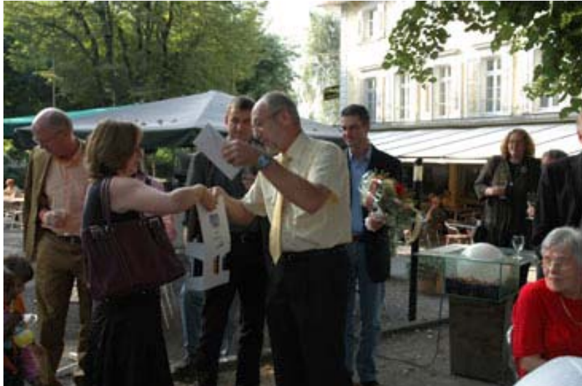
vom abtretenden Ammann