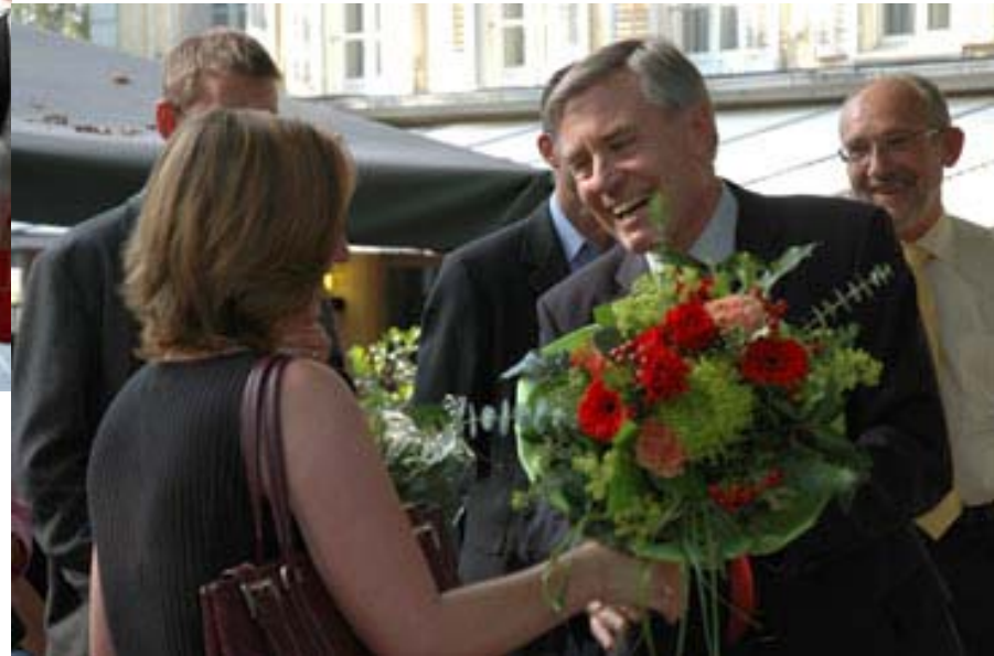
von Oberbürgermeister Niethammer