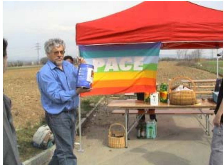
PS und Arbeiter z'Vieri, März 03